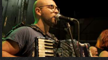
Stritto vico - Dissonthika