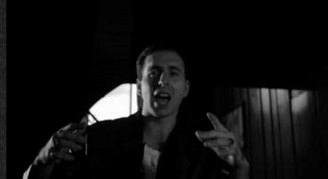
È sempre la stessa storia - Melancholia