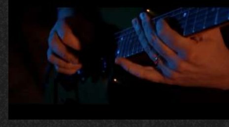
C'è gente e gente - SOLO