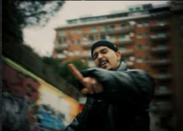
Colpa Mia - Kvstrid